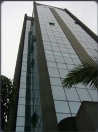
EDIFÍCIO CENTRAL OFFICES Rua Teodoro Sampaio, 352 - Jd América - SP Área construída: 9.630 m 2 Término: 04/95