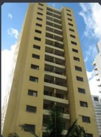
EDIFÍCIO SAINT HILAIRE Rua Dona Avelina, 77 - Vila Mariana - SP Área construída: 7.255 m 2 Término: 04/95