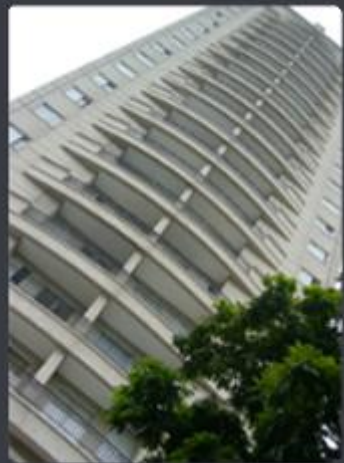
L'ARCO Rua Tibério, 158 - Vila Romana - SP Área construída: 6.890,06 m 2 Término: 12/2007