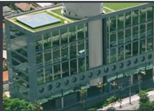
CONDOMÍNIO EDIFÍCIO QUADRA HUNGRIA Rua Hungria, 1400 - Jardim, Paulistano - SP Área construída: 19.800 m 2 Término: 10/2005