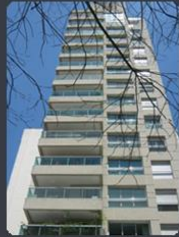
RESIDENCIAL VISIONART Rua Dr. Rafael de Barros, 457 - Paraíso - SP Área construída: 3.672,91m 2 Término: 01/2004