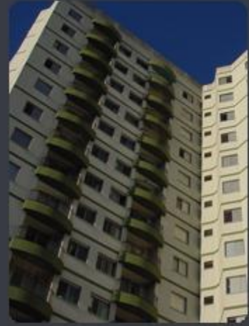
VILLA DI FIORI Rua Carlos Silva, 90 - Vila Carrão - SP Área construída: 8.844,84 m 2 Término: 06/2003