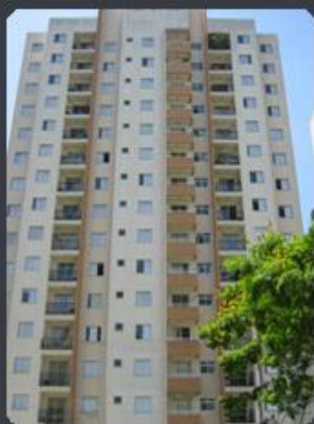
EDIFÍCIO DUO MORUMBI Rua Marie Nader Calfat, 351 - Morumbi - SP Área construída: 12.907,51 m 2 Término: 05/2004