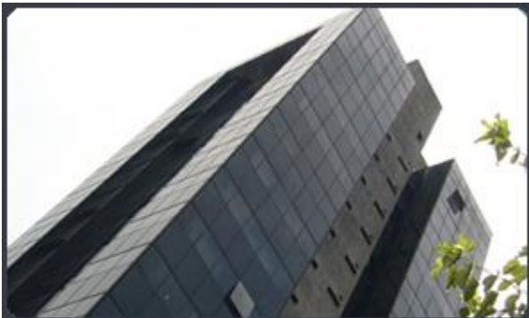
CONDOMÍNIO EDIFÍCIO DUPRET CENTER Rua Leandro Dupre, 204 - Vila Clementino - SP Área construída: 5.300 m 2 Término: 10/89