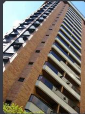
CONTEMPORÂNEO HOME & SERVICE R. Brás Cardoso, 654 - V. Nova Conceição - SP Área construída: 10.800 m 2 Término: 05/90