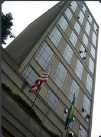
L'HOTEL Al. Campinas, 266 - Bela Vista - SP Área construída: 7.175 m 2 Término: 03/94