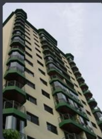
EDIFÍCIO TOP GREEN Rua Caramuru, 1243 - Praça da Árvore - SP Área construída: 8.500 m 2 Término: 07/97