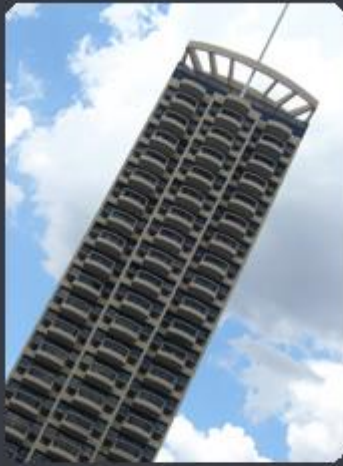
THE CAPITAL FLAT Rua Tenente Negrão, 200 - Vila Olímpia - SP Área construída: 22.400 m 2 Término: 05/2001