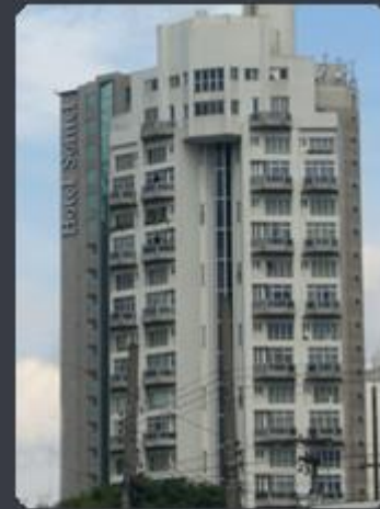
QUASAR Rua Neide Aparecida Sollito, 460 - SP Área construída: 3.100 m 2 Término: 05/86