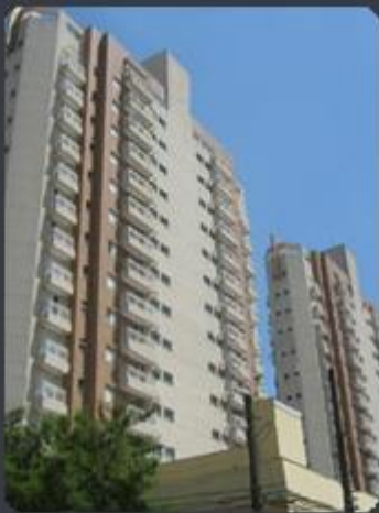
RESIDENCIAL PONTECHIO Rua Oliveira Alves, 495 - Ipiranga - SP Área construída: 10.777,44 m 2 Término: 06/2006