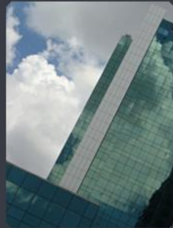
EDIFÍCIO FRANCISCO MELLÃO Rua Funchal, 263 - Vila Olímpia - SP Área construída: 21.000 m 2 Entrega: 10/2000