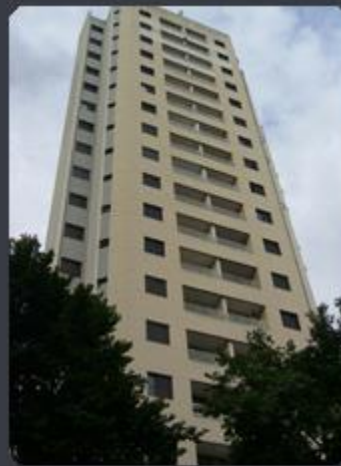
SANTANA LIFE STYLE Rua Macaia Mirim - Santana - SP Área: 9.856 m 2 Término: 12/2002