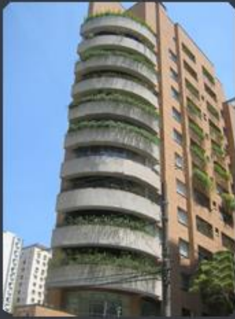
EDIFÍCIO ITAITUBA Rua Araguari, 418 - Moema - SP Área construída: 4.107 m 2 Término: 10/2001