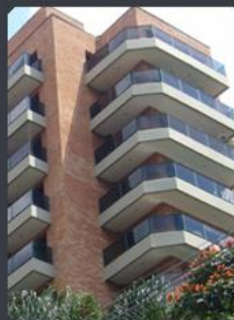
EDIFÍCIO GREEN VILLAGE Rua Bittencourt Sampaio, 268 - Saúde - SP Área construída: 7.559 m 2 Término: 12/99