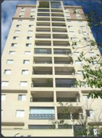
RESIDENCIAL TRIO Rua Gaspar Lourenço, 191 - Vila Mariana - SP Área construída: 5.720,70m 2 Término: 12/2007