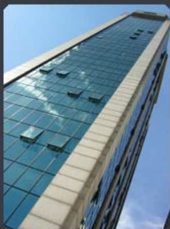
EDIFÍCIO IDEAL OFFICES Rua Afonso Brás, 900 - VI Nova Conceição - SP Área construída: 7.200 m 2 Término: 10/99