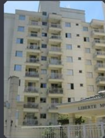
EDIFÍCIO LIBERTÉ Rua Marie Nader Calfat, 621 - Morumbi - SP Área construída: 8.253,19 m 2 Término: 05/2006